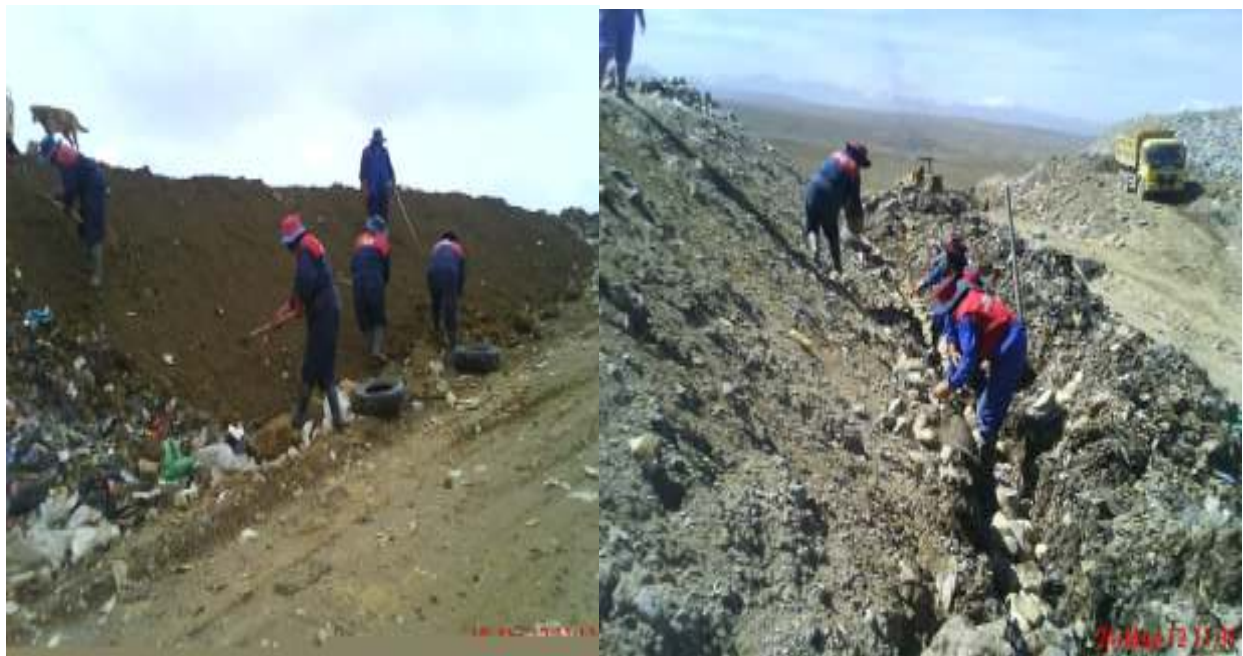
Cahuasa Simón; mujer comunaria como trabajadora dependiente en actividad de peinado del talud en celda de emergencia, fotografía 10 de Abril de y 24 de Mayo de 2012 en construcción de drenajes de captación y recolección de lixiviados en el pie del talud 1 de la macro celda II.