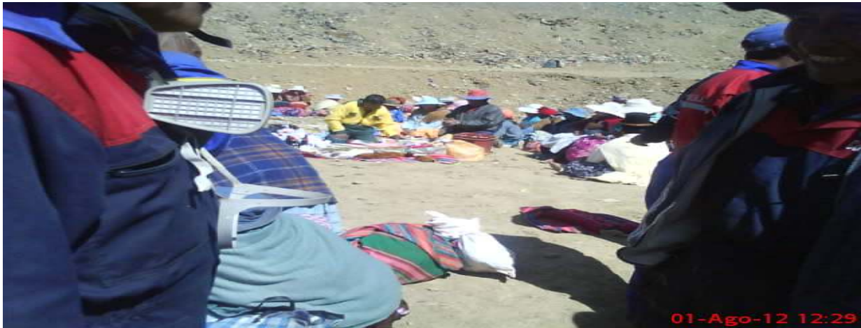
Cahuasa, Simón; celda 7 de la macro celda 3 donde los trabajadores y el yatiri preparan una gran mesa para la wajtha a la pachamama, fotografía 01 de Agosto de 2012.