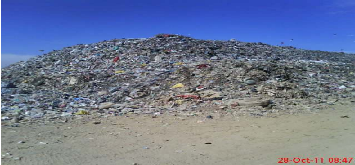
Cahuasa, Simón; disposición final a cielo abierto que simila a un botadero, fotografía 28 de Octubre de 2011.