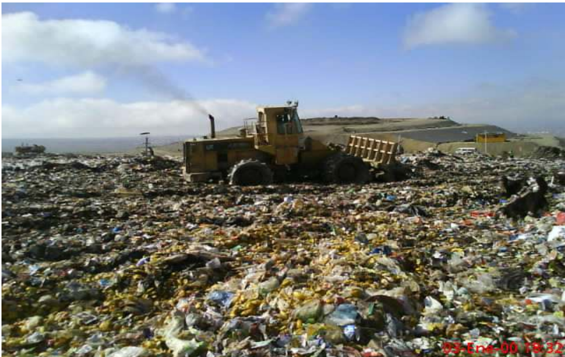
Cahuasa, Simón; la maquinaria pesada en época de lluvia tiene dificultades en compactación, donde los residuos sólidos se encuentran sin cobertura la penetración de aguas pluviales es permanente, fotografía 03 Enero de 2010.