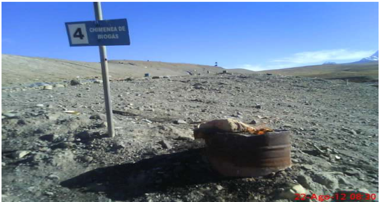
Cahuasa, Simón; chimenea de biogás en la Zona “A” que se encuentra activa en constante combustión, fotografía 22 de Agosto de 2012.