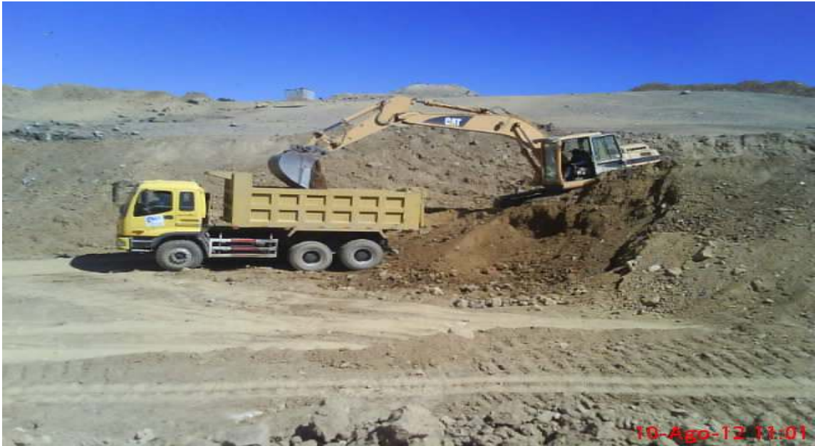
Cahuasa, Simón; construcción de la celda domiciliaria, la maquinaria y el equipo realizan la explotación de tierra, fotografía 10 de Agosto de 2012.