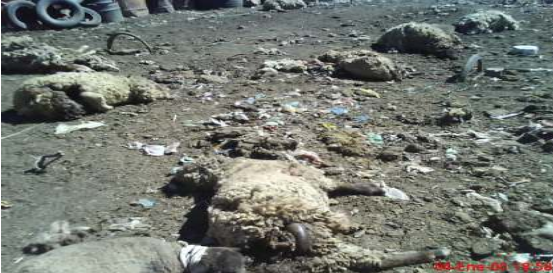
Cahuasa, Simón; en el transcurso de la noche los canes vagabundos atacan a los corrales devorando a las ovejas, que en el día se alimentaban de la basura, fotografía 04 de Enero de 2010.