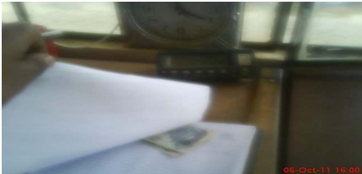
Cahuasa, Simón; en el interior de la caseta de control de báscula, se observa una de las estrategias de percibir ingresos económicos por alteración de peso, fotografía 06 de Octubre de 2011.