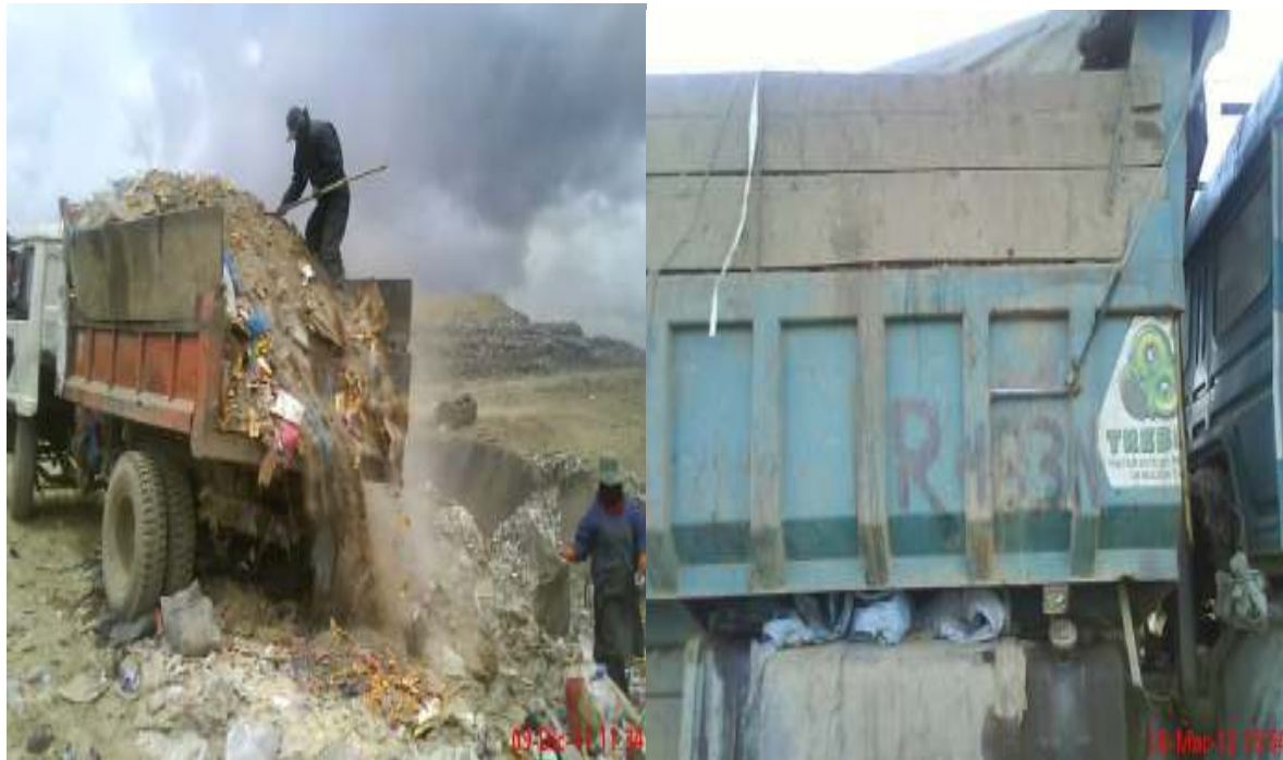
Cahuasa, Simón; volqueta con escombros para aumentar peso en plataforma de descarga de disposición final del relleno sanitario, fotografía 09 de Diciembre de 2011. Y, la volqueta verde ingresa con poca basura a la báscula, fotografía 16 de Marzo de 2012.