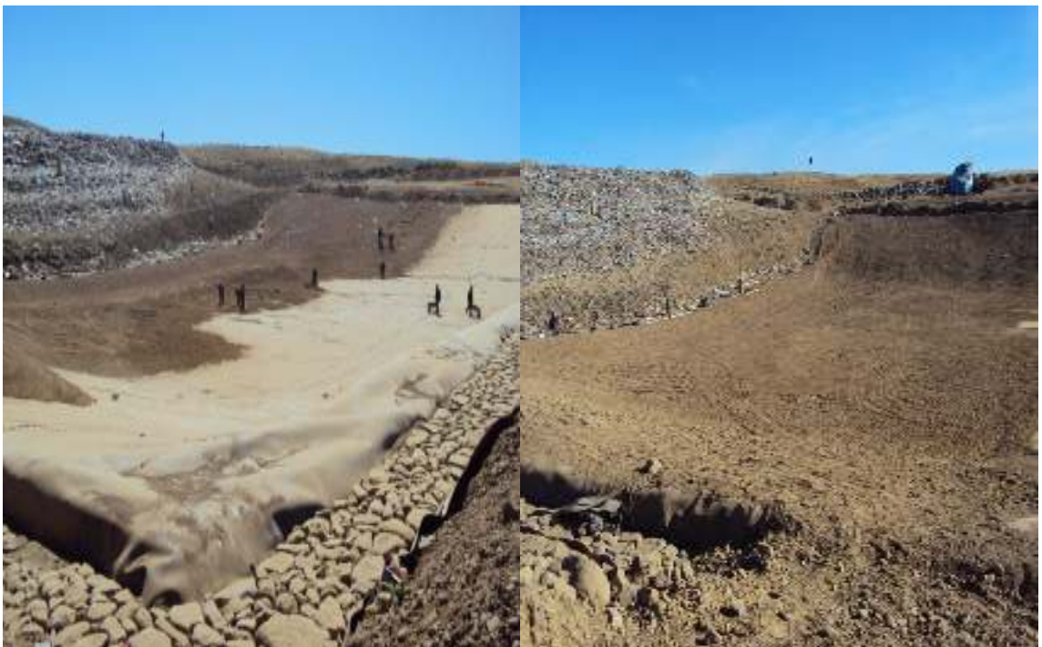
Cahuasa, Simón; actividad del sistema de impermeabilización en la celda 5 de la macro celda II, fotografía 21 de Diciembre de 2010.