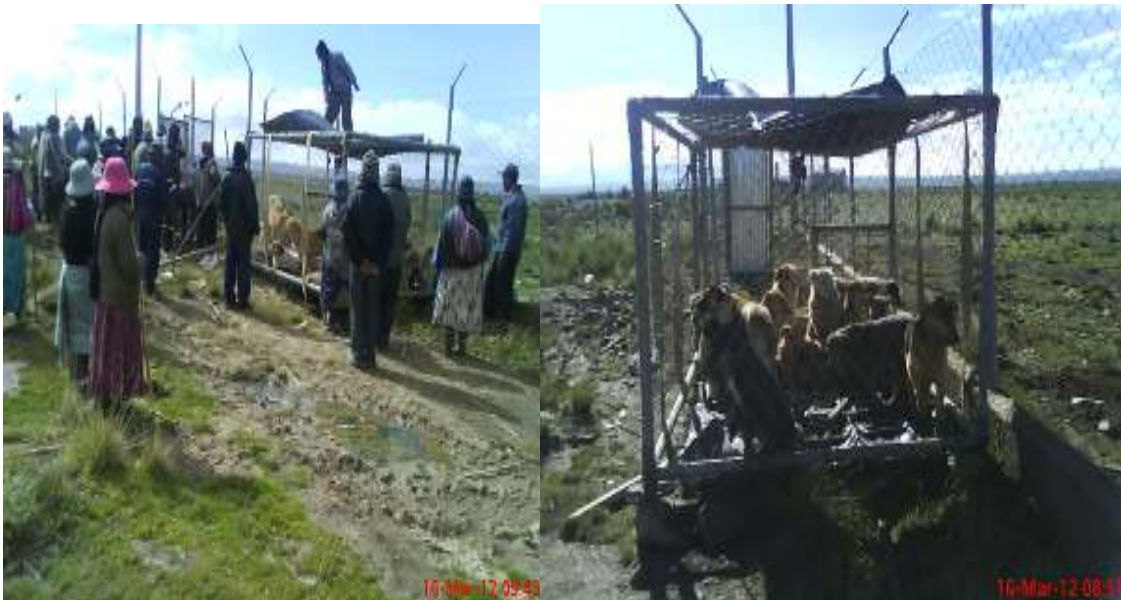
Cahuasa, Simón; familias de comunarios organizados para atrapar y entregar los canes vagabundos al personal de zoonosis, fotografía 16 de Marzo de 2012.