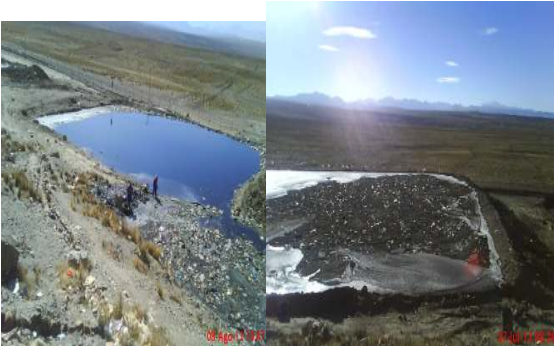
Cahuasa, Simón; piscinas de almacenamiento de lixiviados repletos de residuos y espumas flotantes, y estas mismas no cuentan con sistema de impermeabilización para evitar la filtración subterránea de los lixiviados, fotografía 27 de Julio y 08 de Agosto de 2012.