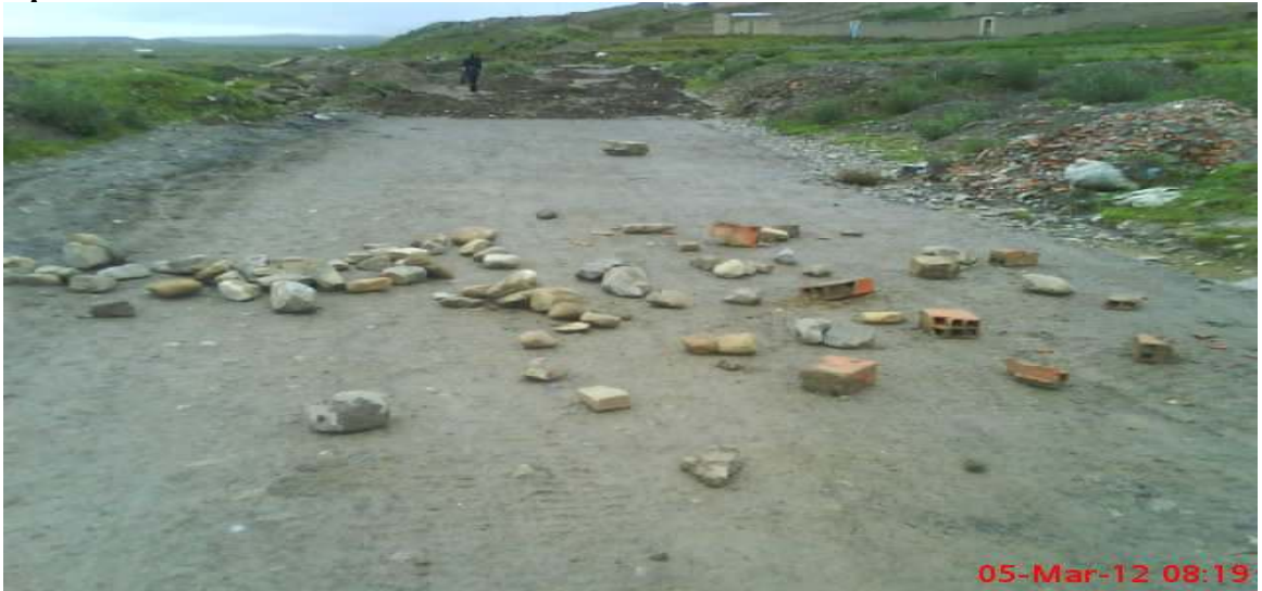
Cahuasa, Simón; el bloque de la vía de acceso principal al relleno sanitario por parte de los vecinos del Distrito No 5, fotografía 05 de Marzo de 2012.